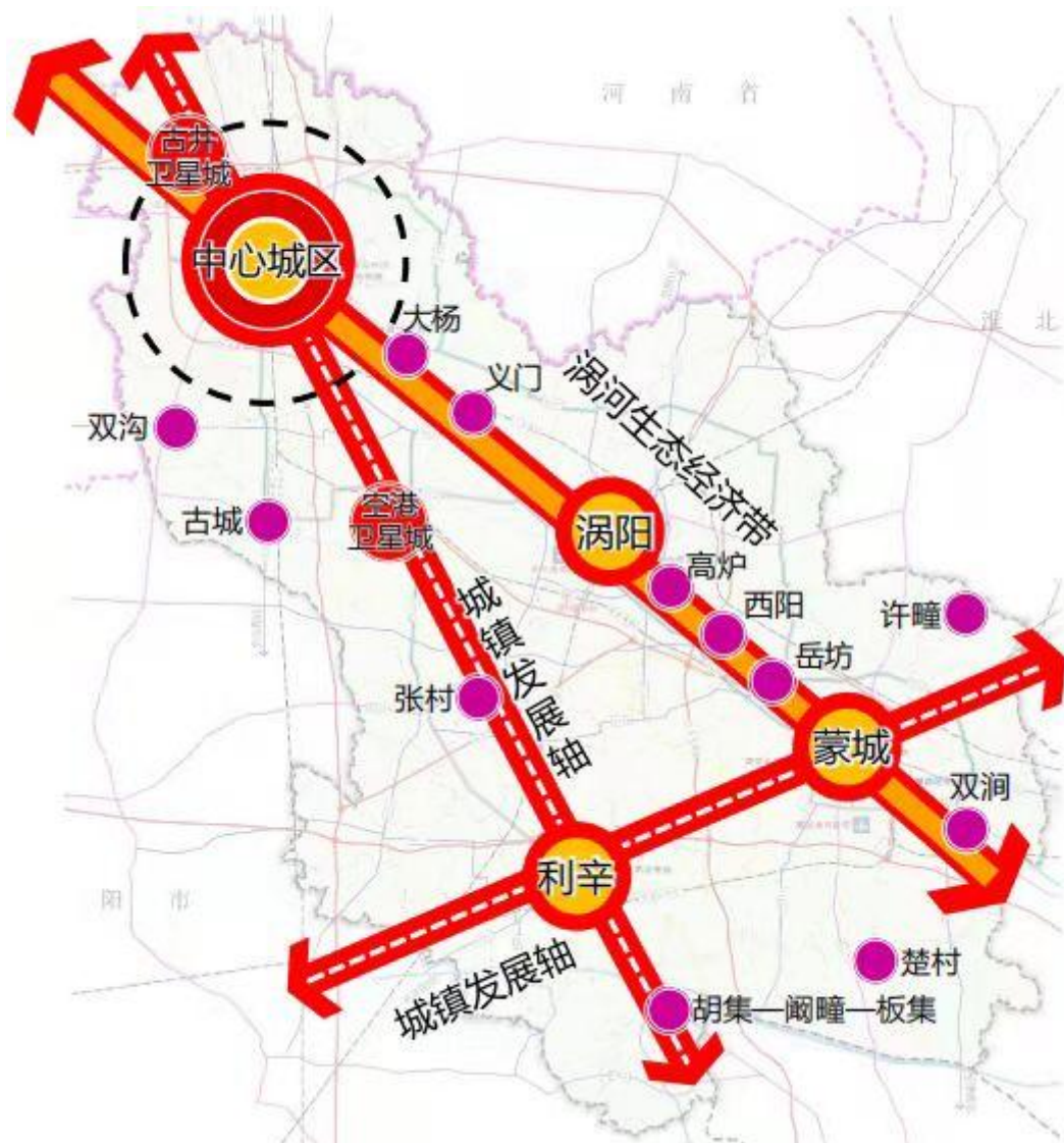
图 2 亳州市城镇化空间发展战略布局图